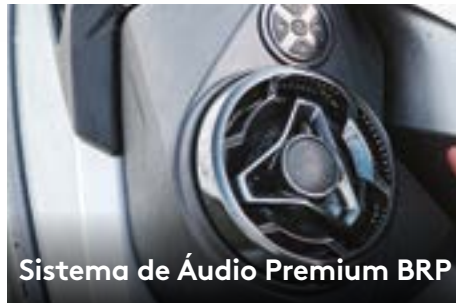
Sistema de Áudio Premium BRP

Amplio compartimento frontal facilmente acessível a partir de uma posição sentada. Organizador incluído para maior comodidade.