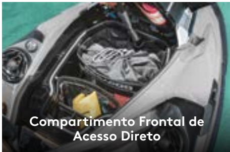
Compartimento Frontal de Acesso Direto

Amplio compartimento frontal facilmente acessível a partir de uma posição sentada. Organizador incluído para maior comodidade.