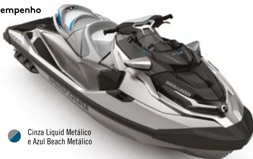
Cinza Liquid Metálico e Azul Beach Metálico