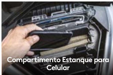
Compartimento Estanque para Celular

Um casco inovador que se tornou referência no mercado para pilotagem em águas agitadas, proporcionando maior estabilidade e desempenho em alto mar.