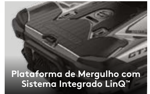
Plataforma de Mergulho com Sistema Integrado LinQ™

O primeiro sistema de áudio Bluetooth ‡ original de fábrica, verdadeiramente à prova de água.