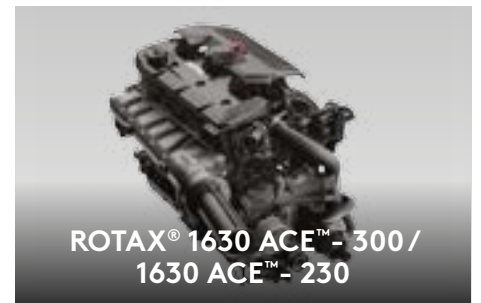
ROTAX® 1630 ACE™ - 300 / 1630 ACE™ - 230

Compartimento à prova de água e choques projetado especificamente para proteção do telefone.